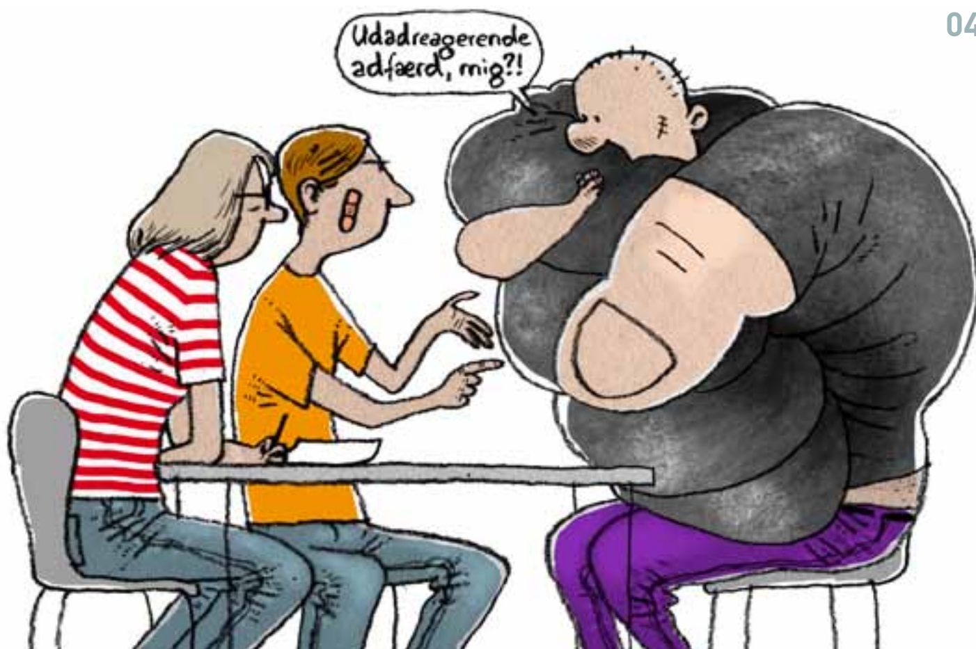
ILLUSTRATION: GITTE SKOV