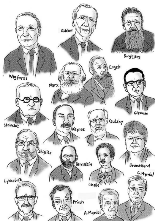
De 17 tænkere, du kan læse om i 'Socialdemokratiske Tænkere'.