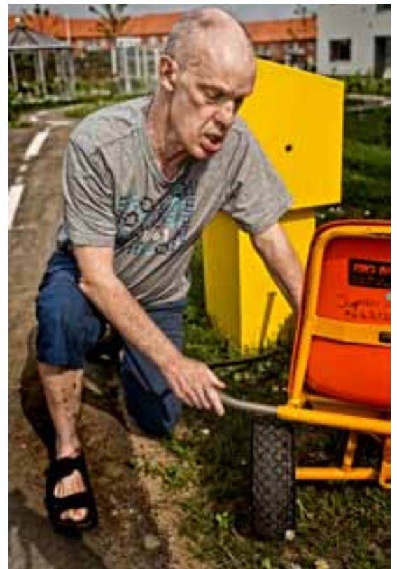
TANKNING Det er en stor frustration for mange sent-udviklede, at de ikke har kørekort. Mooncarbanen har midterstriber og højtænder – og der er en benzinstander ved foden af bakken