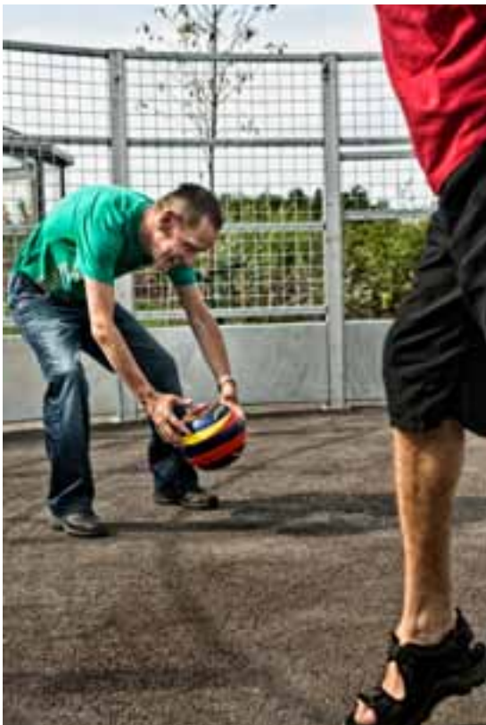
BOLDLEG Boldburet, en pannabane, er konstrueret, så det inviterer til mindre voldsomt spil end normalt for drenge i den alder