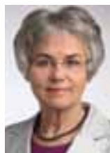
Af Anny Winther, KL

O m kort tid er der kommunalvalg. Det er et vigtigt valg for os alle sammen. De politikere, der vælges til at sidde i kommunalbestyrelserne, bestemmer over en stor del af den danske samfundsøkonomi. Og selv om der på nogle områder er alt for meget bureaukrati og detaljstyring, er der fortsat et stort rum for lokale beslutninger.