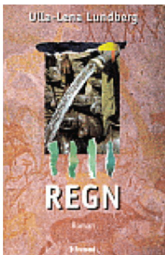
(/boeger/regn) REGN (/BOEGER/REGN) Af Ulla-Lena Lundberg