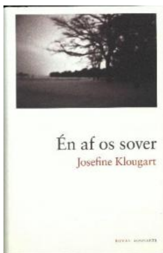
(/boeger/en-af-os-sover) ÉN AF OS SOVER (/BOEGER/EN-AF-OS-SOVER) Af Josefine Klougart