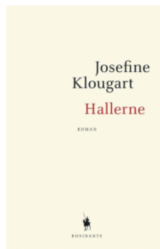
(/boeger/hallerne) HALLERNE (/BOEGER/HALLERNE) Af Josefine Klougart