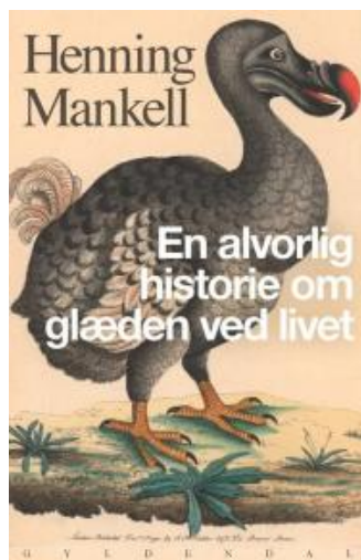
(/boeger/en-alvorlig-historie-om-glaeden-ved-livet) EN ALVORLIG HISTORIE OM GLÆDEN VED LIVET (/BOEGER/EN-ALVORLIG-HISTORIE-OM-GLAEDEN-VED-LIVET) Af Henning Mankell