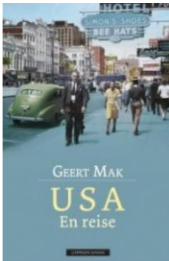
(/boeger/usa-en-rejse) USA - EN REJSE (/BOEGER/USA-EN-REJSE) Af Geert Mak