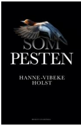
(/boeger/som-pesten) SOM PESTEN (/BOEGER/SOM-PESTEN) Af Hanne-Vibeke Holst