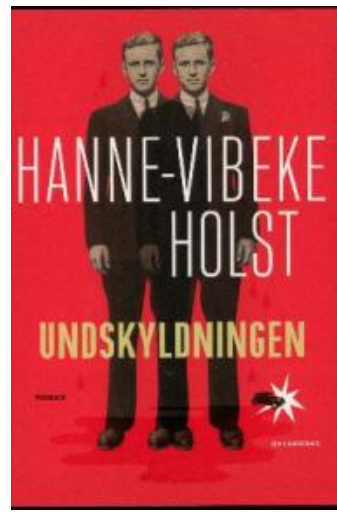
(/boeger/undskyldningen) UNDSKYLDNINGEN (/BOEGER/UNDSKYLDNINGEN) Af Hanne-Vibeke Holst