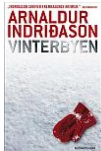
(/boeger/vinterbyen) VINTERBYEN (/BOEGER/VINTERBYEN) Af Arnaldur Indriðason