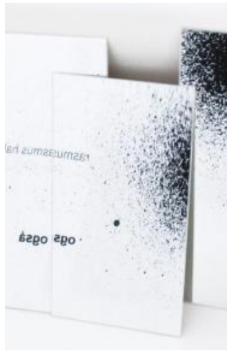
(/boeger/ogsa) OGSÅ (/BOEGER/OGSA) Af Rasmus Halling