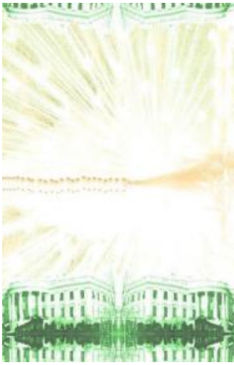
(/boeger/not-found) NOT FOUND (/BOEGER/NOT-FOUND) Af Rasmus Halling Nielsen