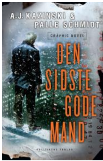
(/boeger/den-sidste-gode-mand-graphic-novel) DEN SIDSTE GODE MAND - GRAPHIC NOVEL (/BOEGER/DEN-SIDSTE-GODE-MAND-GRAPHIC-NOVEL) Af A.J. Kazinski