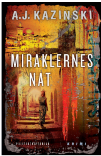
(/boeger/miraklernes-nat) MIRAKLERNES NAT (/BOEGER/MIRAKLERNES-NAT) Af A. J. Kazinski