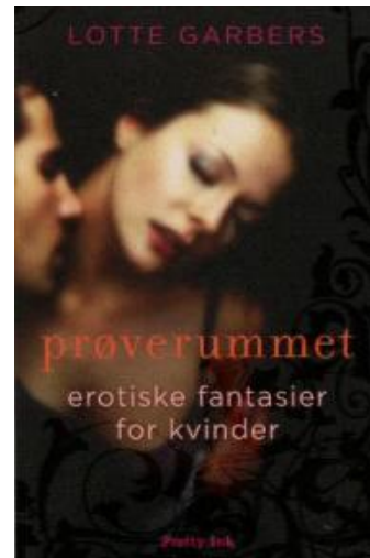
(/boeger/proverummet) PROVERUMMET (/BOEGER/PROVERUMMET) Af Lotte Garbers