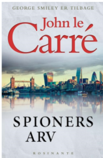
(/boeger/spioners-arv) SPIONERS ARV (/BOEGER/SPIONERS-ARV) Af John le Carré