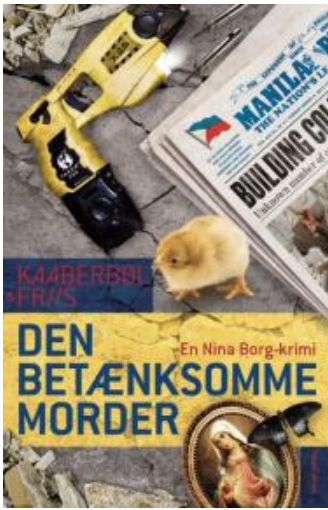
(/boeger/den-betaenksomme-morder) DEN BETÆNKSOMME MORDER (/BOEGER/DEN-BETAENKSOMME-MORDER) Af Lene Kaaberbøl