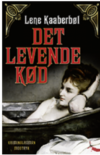
(/boeger/det-levende-kod) DET LEVENDE KØD (/BOEGER/DET-LEVENDE-KOD) Af Lene Kaaberbøl