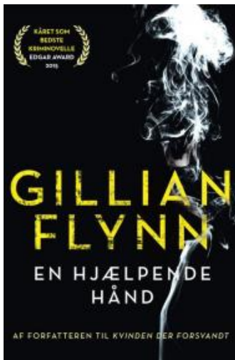
(/boeger/en-hjaelpende-hand) EN HJÆLPENDE HÅND (/BOEGER/EN-HJÆLPENDE-HAND) Af Gillian Flynn