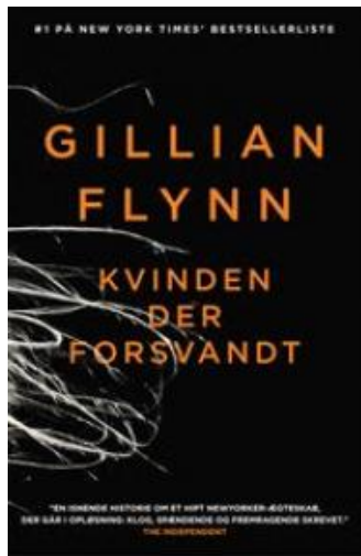
(/boeger/kvinden-der-forsvandt-0) KVINDEN DER FORSVANDT (/BOEGER/KVINDEN-DER-FORSVANDT-0) Af Gillian Flynn