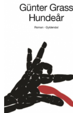
(/boeger/hundeår-0) HUNDEÅR (/BOEGER/HUNDEAR-0) Af Günter Grass