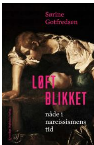
(/boeger/loft-blikket) LØFT BLIKKET (/BOEGER/LOFT-BLIKKET) Af Sørine Godtfredsen