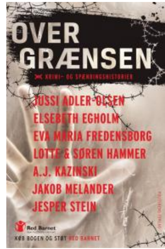
(/boeger/over-graensen-krimi-og- spændingshistorier) OVER GRÆNSEN, KRIMI-OG SPÆNDINGSHISTORIER (/BOEGER/OVER- GRAENSEN-KRIMI-OG- SPAENDINGSHISTORIER) Af diverse forfattere