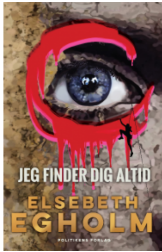
(/boeger/jeg-finder-dig-altid) JEG FINDER DIG ALTID (/BOEGER/JEG- FINDER-DIG-ALTID) Af Elsebeth Egholm