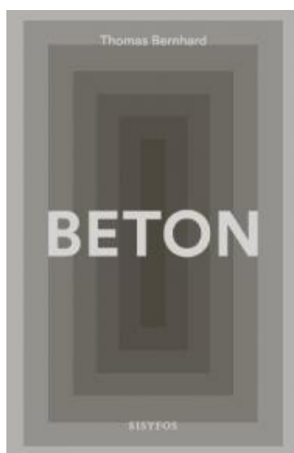
(/boeger/beton-0) BETON (/BOEGER/BETON-0) Af Thomas Bernhard