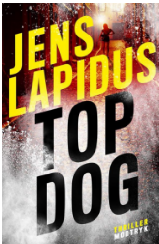
(/boeger/top-dog) TOP DOG (/BOEGER/TOP-DOG) Af Jens Lapidus