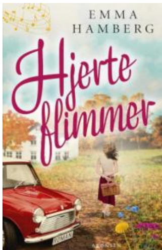
(/boeger/hjerteflimmer) HJERTEFLIMMER (/BOEGER/HJERTEFLIMMER) Af Emma Hamberg