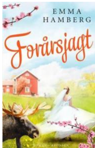
(/boeger/forarsjagt) FORÅRSJAGT (/BOEGER/FORARSJAGT) Af Emma Hamberg