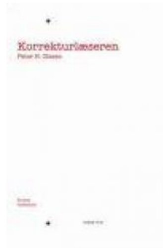
(/boeger/korrekturlaeseren) KORREKTURLÆSEREN (/BOEGER/KORREKTURLAESEREN) Af Peter H. Olesen