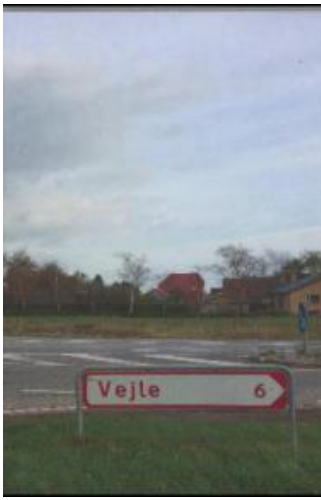
(/boeger/atlas-over-vejle) ATLAS OVER VEJLE (/BOEGER/ATLAS-OVER-VEJLE) Af Peter H. Olesen