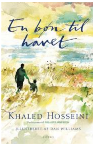
(/boeger/en-bon-til-havet) EN BØN TIL HAVET (/BOEGER/EN-BON-TIL-HAVET) Af Khaled Hosseini