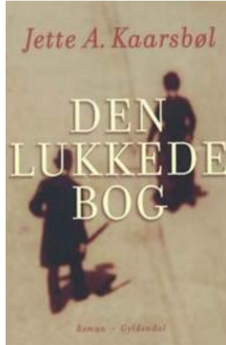
(/boeger/den-lukkede-bog) DEN LUKKEDE BOG (/BOEGER/DEN-LUKKEDE-BOG) Af Jette A. Kaarsbøl