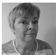
Af Beth Høst (/users/beth-host)