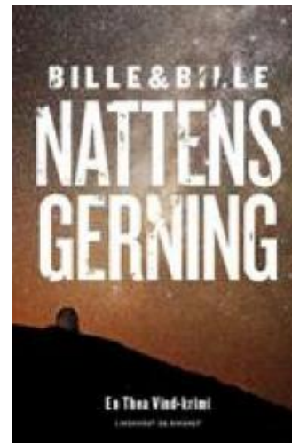
(/boeger/nattens-gerning) NATTENS GERNING (/BOEGER/NATTENS-GERNING) Af Lisbeth A. Bille og Steen Bille