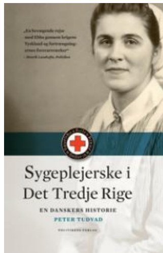
(/boeger/sygeplejerske-i-det-tredje-rige) SYGEPLEJERSKE I DET TREDJE RIGE (/BOEGER/SYGEPLEJERSKE-I-DET-TREDJE-RIGE) Af Peter Tudvad