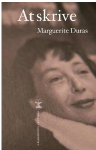
(/boeger/skrive) AT SKRIVE (/BOEGER/SKRIVE) Af marguerite duras