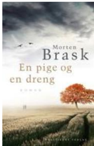
(/boeger/en-pige-og-en-dreng) EN PIGE OG EN DRENG (/BOEGER/EN-PIGE- OG-EN-DRENG) Af Morten Brask