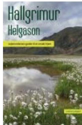
(/boeger/lejemorderens-guide-til-et-smukt-hjem) LEJEMORDERENS GUIDE TIL ET SMUKT HJEM (/BOEGER/LEJEMORDERENS-GUIDE-TIL-ET-SMUKT-HJEM) Af Hallgrímur Helgason