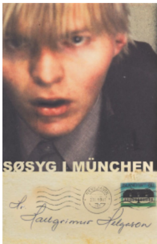
(/boeger/sosyg-i-munchen) SØSYG I MÜNCHEN (/BOEGER/SOSYG-I-MUNCHEN) Af Hallgrímur Helgason