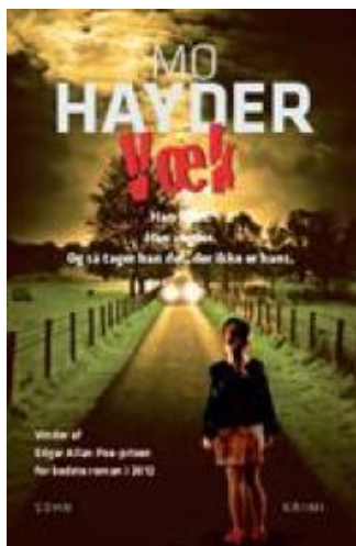
(/boeger/væk) VÆK (/BOEGER/VAEK) Af Mo Hayder