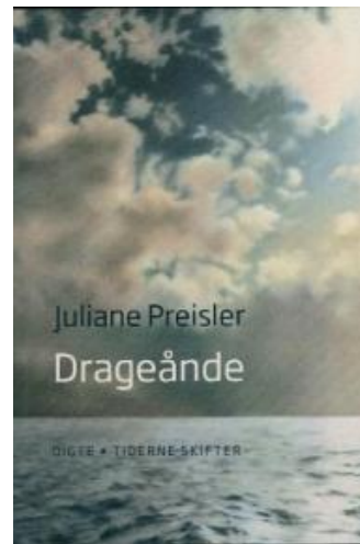
(/boeger/drageande) DRAGEÅNDE (/BOEGER/DRAGEANDE) Af Juliane Preisler