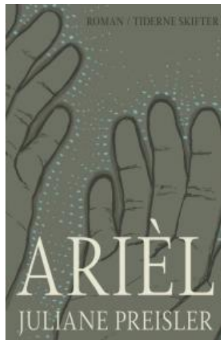
(/boeger/ariel-0) ARIËL (/BOEGER/ARIEL-0) Af Juliane Preisler