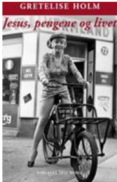
(/boeger/jesus-pengene-og-livet) JESUS, PENGENE OG LIVET (/BOEGER/JESUS-PENGENE-OG-LIVET) Af Gretelise Holm