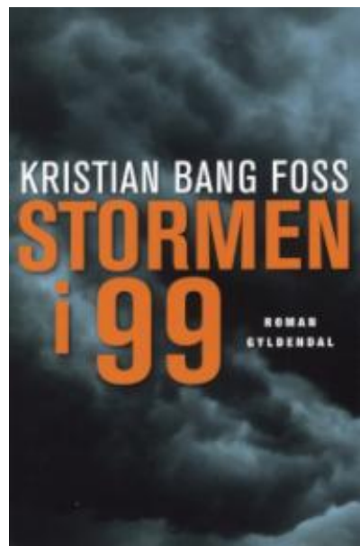
(/boeger/stormen-i-99) STORMEN I 99 (/BOEGER/STORMEN-I-99) Af Kristian Bang Foss