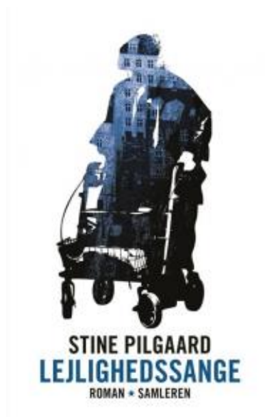
(/boeger/lejlighedssange) LEJLIGHEDSSANGE (/BOEGER/LEJLIGHEDSSANGE) Af Stine Pilgaard