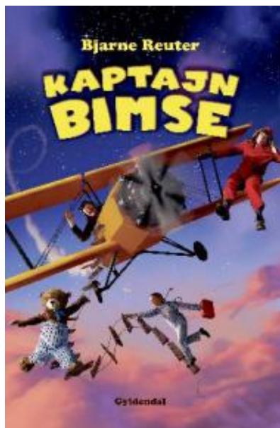
(/boeger/kaptajn-bimse) KAPTJAJN BIMSE (/BOEGER/KAPTJAJN-BIMSE) Af Bjarne Reuter