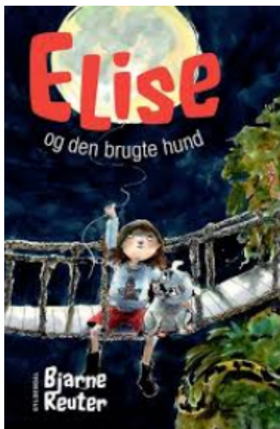
(/boeger/elise-og-den-brugte-hund) ELISE OG DEN BRUGTE HUND (/BOEGER/ELISE-OG- DEN-BRUGTE-HUND) Af Bjarne Reuter