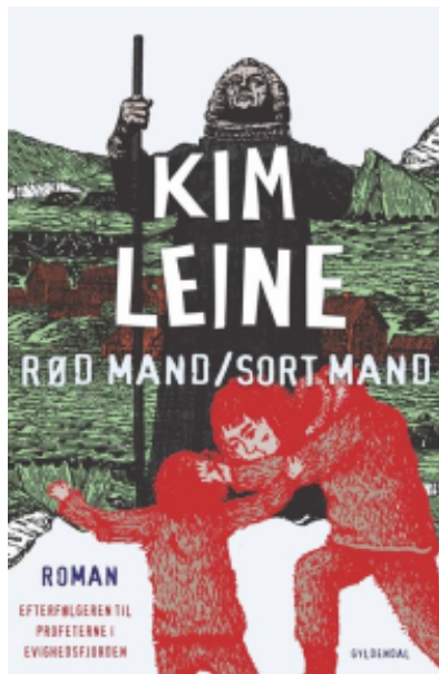
(/boeger/rod-mandsort-mand) RØD MAND/SORT MAND (/BOEGER/ROD-MANDSORT- MAND) Af Kim Leine