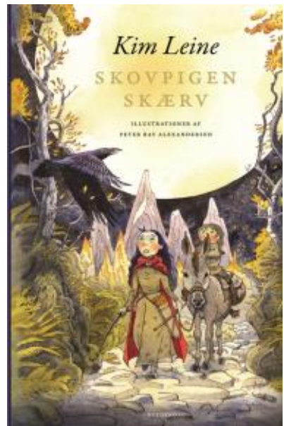
(/boeger/skovpigen-skaerv) SKOVPIGEN SKÆRV (/BOEGER/SKOVPIGEN-SKAERV) Af Kim Leine