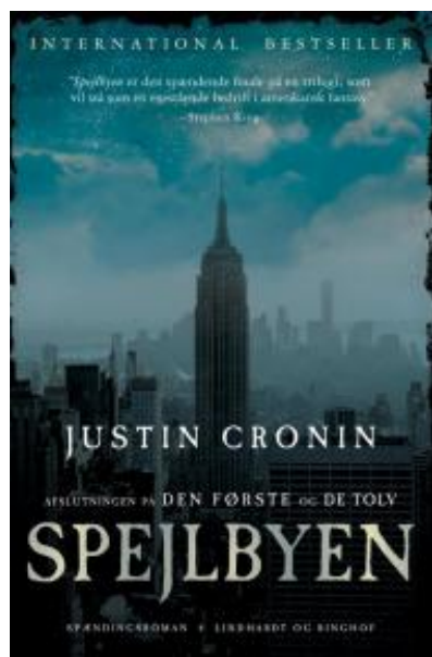
(/boeger/spejlbyen-0) SPEJLBYEN (/BOEGER/SPEJLBYEN-0) Af Justin Cronin