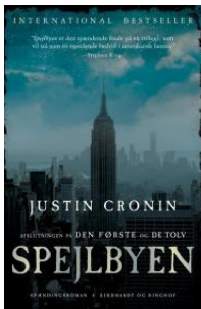
(/boeger/spejlbyen) SPEJLBYEN (/BOEGER/SPEJLBYEN) Af Justin Cronin