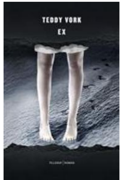
(/boeger/ex) EX (/BOEGER/EX) Af Teddy Vork