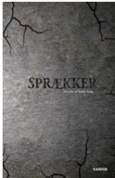
(/boeger/spraekker-0) SPRÆKKER (/BOEGER/SPRAEKKER-0) Af Teddy Vork