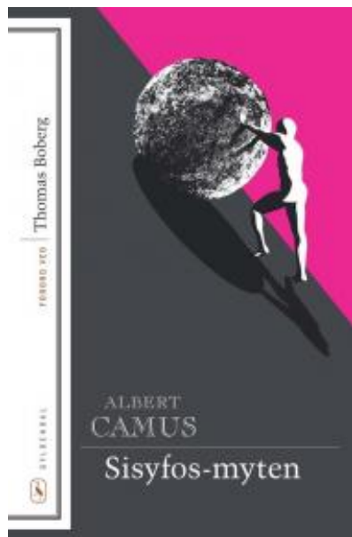
(/boeger/sisyfos-myten) SISYFOS-MYTEN (/BOEGER/SISYFOS-MYTEN) Af Albert Camus