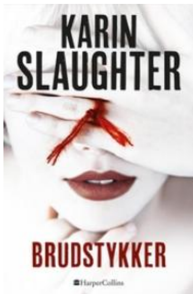
(/index.php/boeger/brudstykker-0) BRUDSTYKKER (/INDEX.PHP/BOEGER/BRUDSTYKKER-0) Af Karin Slaughter