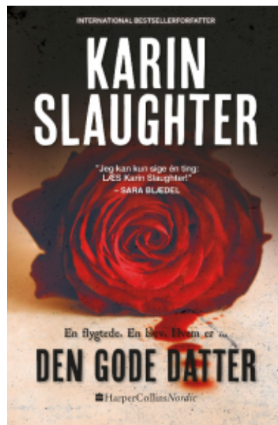
(/index.php/boeger/den-gode-datter-0) DEN GODE DATTER (/INDEX.PHP/BOEGER/DEN-GODE-DATTER-0) Af Karin Slaughter