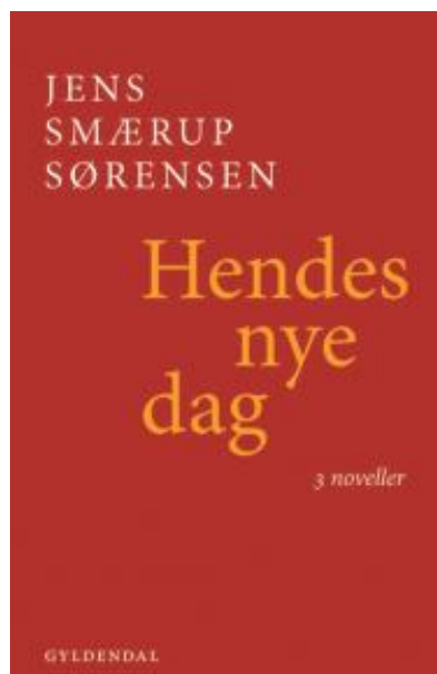
(/boeger/hendes-nye-dag) HENDES NYE DAG (/BOEGER/HENDES-NYE-DAG) Af Jens Smærup Sørensen