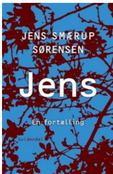
(/boeger/jens-en-fortaelling) JENS : EN FORTÆLLING (/BOEGER/JENS-EN-FORTAELLING) Af Jens Smærup Sørensen