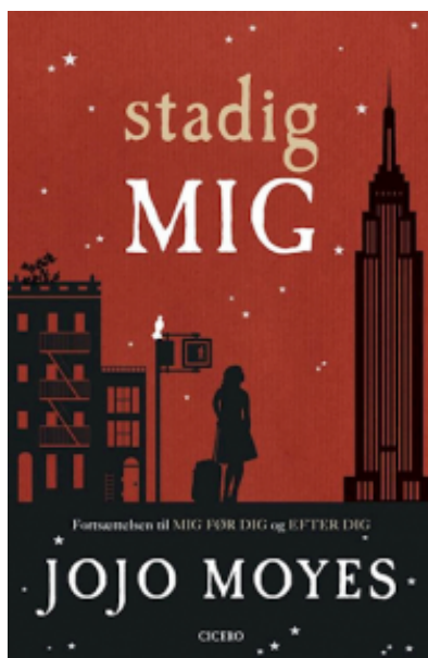
(/boeger/stadig-mig) STADIG MIG (/BOEGER/STADIG-MIG) Af Jojo Moyes