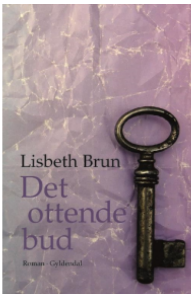
(/boeger/det-ottende-bud) DET OTTENDE BUD (/BOEGER/DET-OTTENDE-BUD) Af Lisbeth Brun