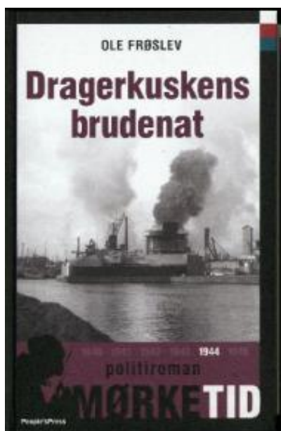
(/boeger/dragerkusens-brudenat) DRAGERKUSKENS BRUDENAT (/BOEGER/DRAGERKUSKENS- BRUDENAT) Af Ole Frøslev