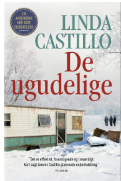
(/boeger/de-ugudelige) DE UGUDELIGE (/BOEGER/DE-UGUDELIGE) Af Linda Castillo