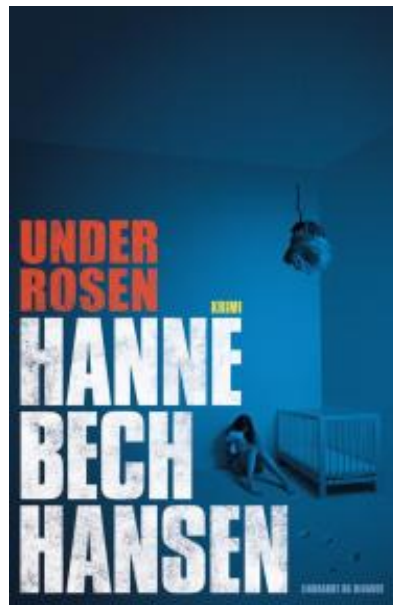
(/boeger/under-rosen) UNDER ROSEN (/BOEGER/UNDER-ROSEN) Af Hanne Bech Hansen