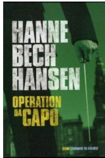
(/boeger/operation-dacapo) OPERATION DACAPO (/BOEGER/OPERATION-DACAPO) Af Hanne Bech Hansen