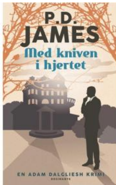
(/boeger/med-kniven-i-hjertet) MED KNIVEN I HJERTET (/BOEGER/MED-KNIVEN-I-HJERTET) Af P. D. James