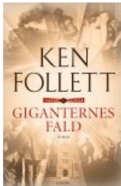
(/boeger/giganternes-fald) GIGANTERNES FALD (/BOEGER/GIGANTERNES-FALD) Af Ken Follett