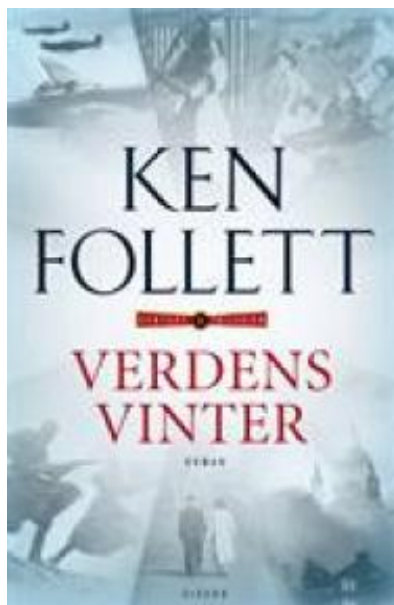
(/boeger/verdens-vinter) VERDENS VINTER (/BOEGER/VERDENS-VINTER) Af Ken Follett