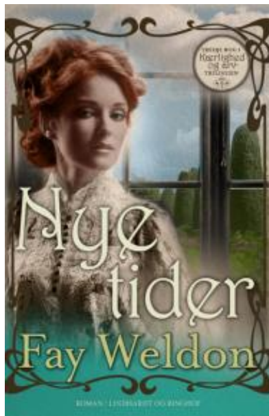
(/boeger/nye-tider-0) NYE TIDER (/BOEGER/NYE-TIDER-0) Af Fay Weldon