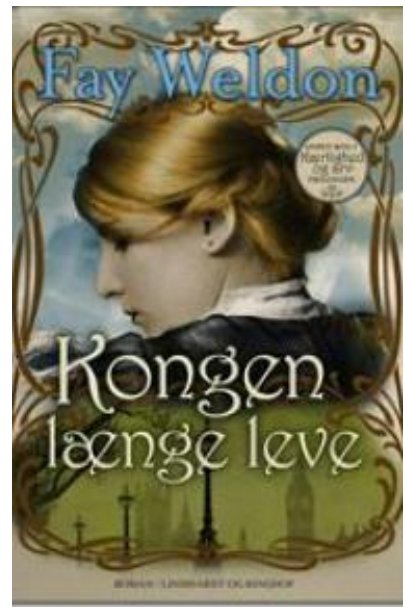
(/boeger/kongen-laenge-leve) KONGEN LÆNGE LEVE (/BOEGER/KONGEN-LAENGE-LEVE) Af Fay Weldon